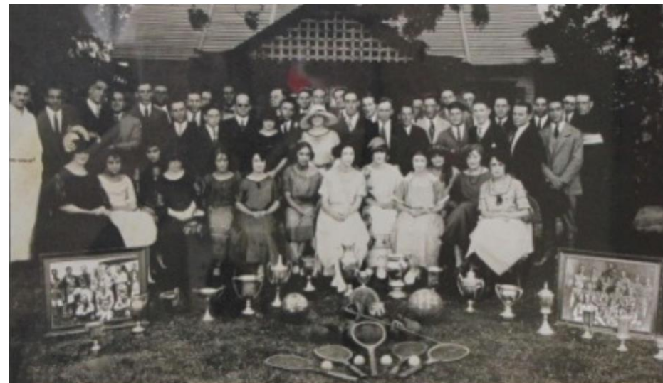
Fotografía del Club Deportivo Hércules del año 1923

La Revolución del 44 marca la nueva era del deporte en Guatemala. La Organización Deportiva alcanza el mayor grado de estructuración con la creación de la Confederación Deportiva Autónoma de Guatemala (C.D.A.G.) y con esto la conformación de las federaciones deportivas.