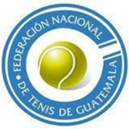
Ilustración programa 11